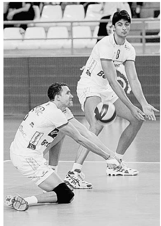
Juantorena in ricezione ieri migliore in campo