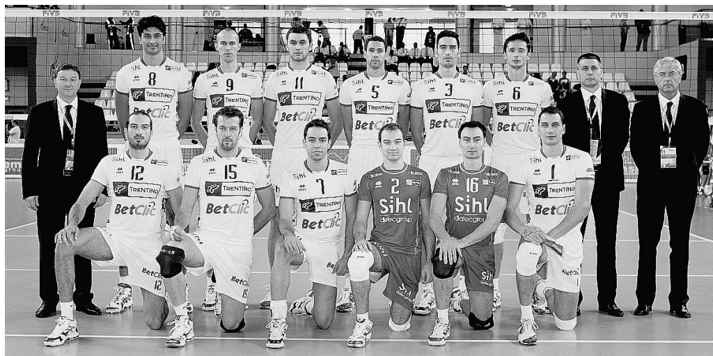
Foto ricordo per la Trentino BetClic prima del fischio d'inizio della prima gara del Mondiale di Doha

Vissotto: «Il 4° set lo ha vinto Osmany da solo» Birarelli: «Per noi centrali le sensazioni sono molto strane»